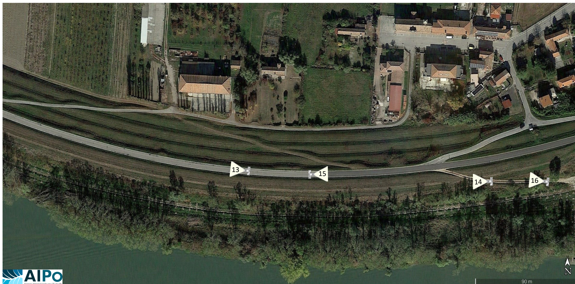
Disposizione coni di visuale 4