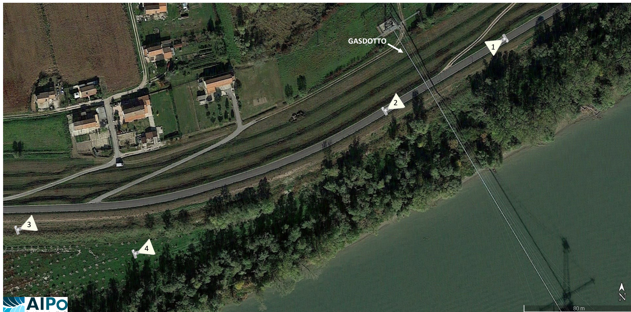
Disposizione coni di visuale 1